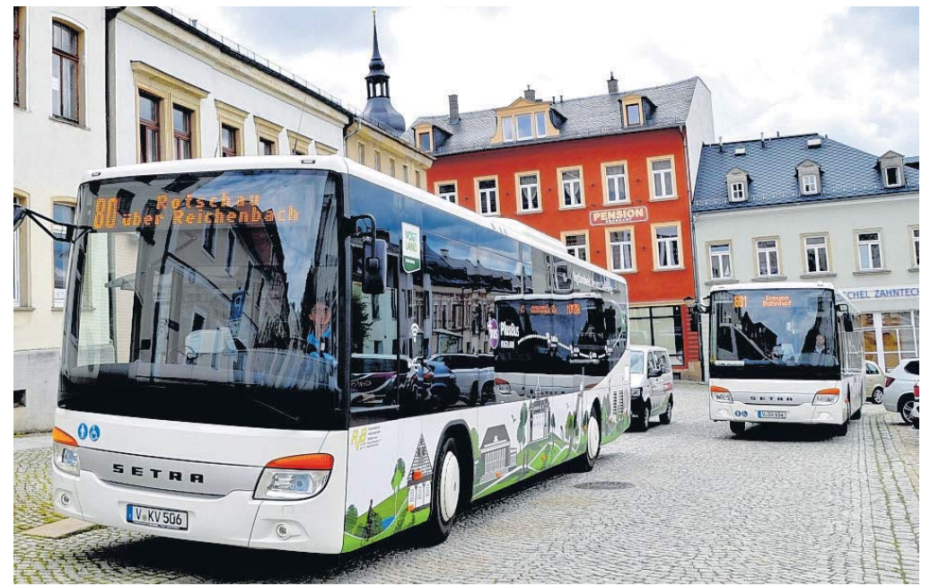
Die Linie 80 führt von Treuen über Netzschkau, Mylau, Reichenbach bis nach Rotschau. Oder man steigt in die Linie 84 ein, um das wunderschöne Göltzschtal zu genießen, um dann in Reichenbach die Stadt selbst sowie das LAGA-Gelände zu erkunden.

Der Taktbus bietet den gleichen Komfort wie der PlusBus und hält auch in Ihrer Nähe. Im Zweistunden-Takt und auf ausgewählten Linien oder durch Überlagerung mehrerer Linien sogar im Stundentakt werden die Halte-